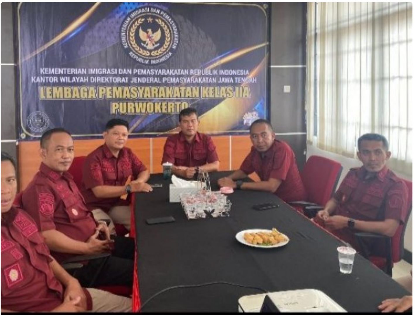
Lapas Purwokerto Ikuti Penguatan Kehumasan terkait Etika Penggunaan Media Sosial

PURWOKERTO Lembaga Pemasyarakatan (Lapas) Kelas IIA Purwokerto